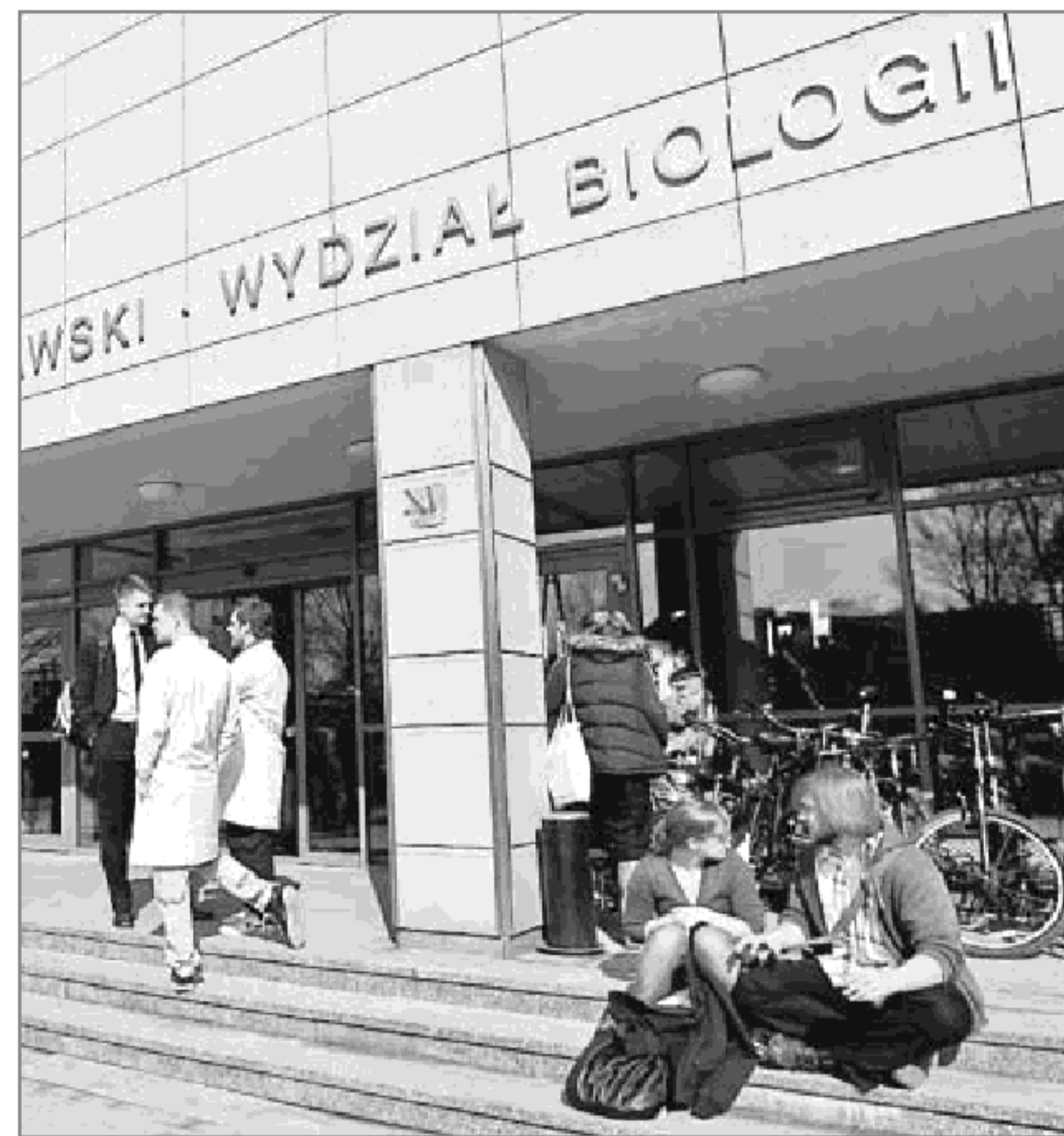
Wydział biologii Uniwersytetu Warszawskiego został wyróżniony przez PKA

Z kolei w innej szkole na kierunku ekonomia prowadzono